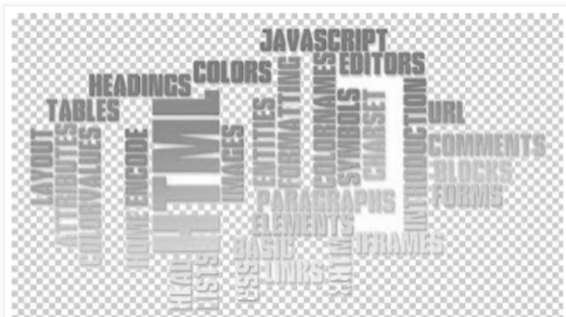
Obraz 1. Obraz napisy.pole szachownicy oznacza przezroczystość