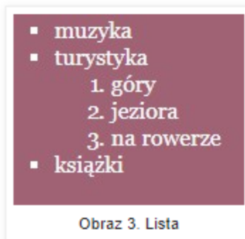
Obraz 3. Lista